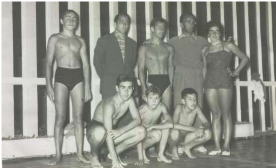
Nadadores do Ginásio que conquistaram títulos regionais em 1957