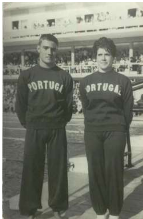
Jogos luso-brasileiros – Figueira da Foz – 1960

Durante a sua carreira, foi 33 vezes campeã regional da Associação de Natação de Coimbra, e conquistou 8 títulos de campeã nacional – dois em Aveiro (1958 e 59), dois em Tomar (1961), dois na Figueira da Foz (1962) e dois em Braga (1963) – nas provas de 100 metros livres (4), 200 livres (3) e 100 mariposa (1).