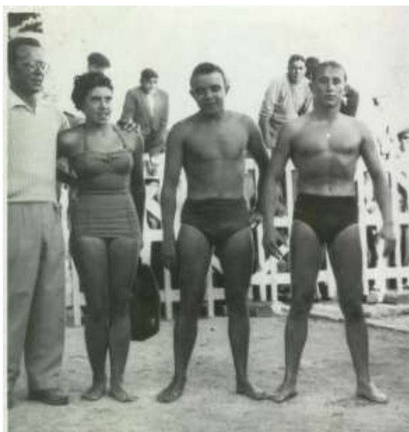
500 metros do Mondego (inter-clubes) – 3ª - 1957

Os records nacionais de categorias foram obtidos nas provas de 200 metros costas, aspirantes (Coimbra, 1959), 100 metros livres, aspirantes (Aveiro, 1959), 100 metros mariposa, seniores (Tomar, 1961), e os records absolutos foram um individual, nos 200 metros mariposa (Figueira da Foz, 1961), e outro na estafeta 4x100 metros livres, com a equipa nacional (Algés, 1960).