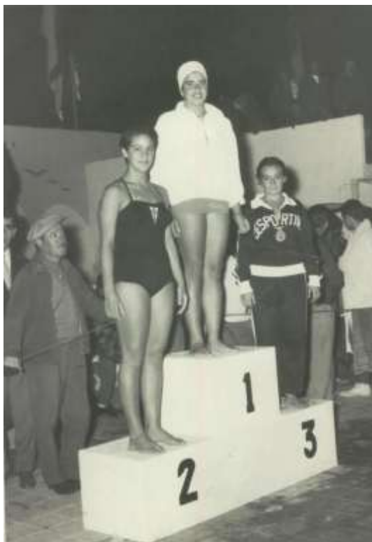
Campeã Nacional de 100 metros livres Aveiro – 1958

Durante a sua carreira, foi 33 vezes campeã regional da Associação de Natação de Coimbra, e conquistou 8 títulos de campeã nacional – dois em Aveiro (1958 e 59), dois em Tomar (1961), dois na Figueira da Foz (1962) e dois em Braga (1963) – nas provas de 100 metros livres (4), 200 livres (3) e 100 mariposa (1).