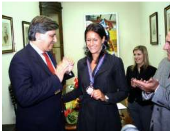
Muitos aplausos sublinharam a condecoração