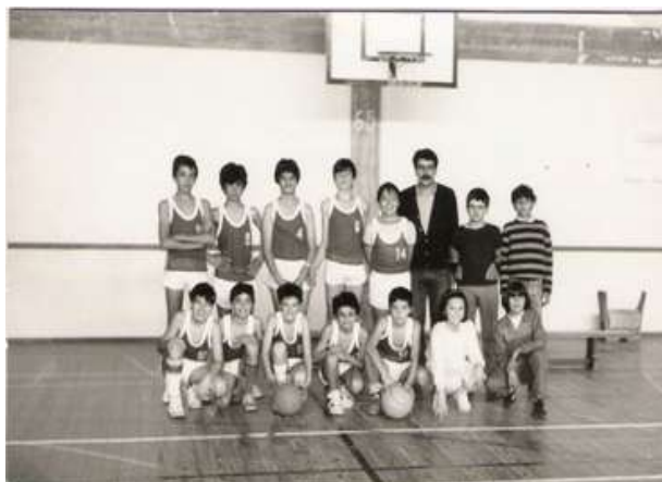
Com 11 anos, treinando na equipa dos rapazes (época de 85-86); é a primeira a contar da direita, em baixo

Iniciou-se no Basquetebol aos 6 anos, começou a praticar a nível oficial aos 11, no Ginásio Clube Figueirense, e aos 16 representou pela primeira vez Portugal, tendo já participado em 101 jogos da Selecção Nacional.