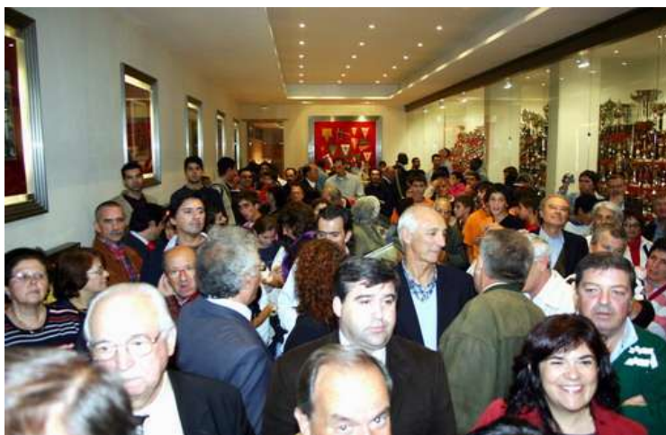
Uma enchente para aplaudir a campeã