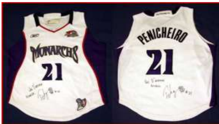
Ticha ofereceu ao seu primeiro Clube a camisola de Campeã da WNBA, a qual figura em lugar de honra na Sala Museu do Ginásio